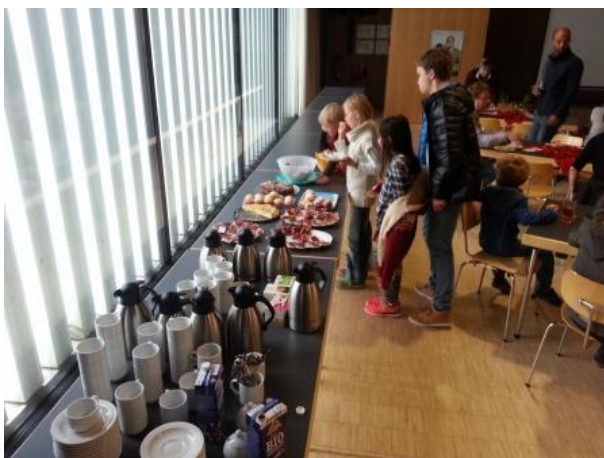
Buffet, „salzig, süß“