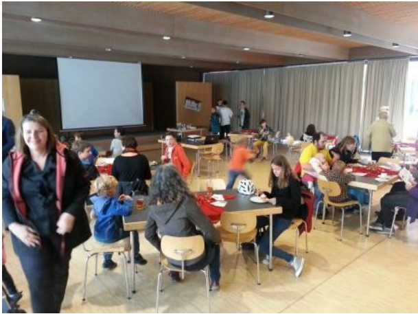
Gleich geht's los