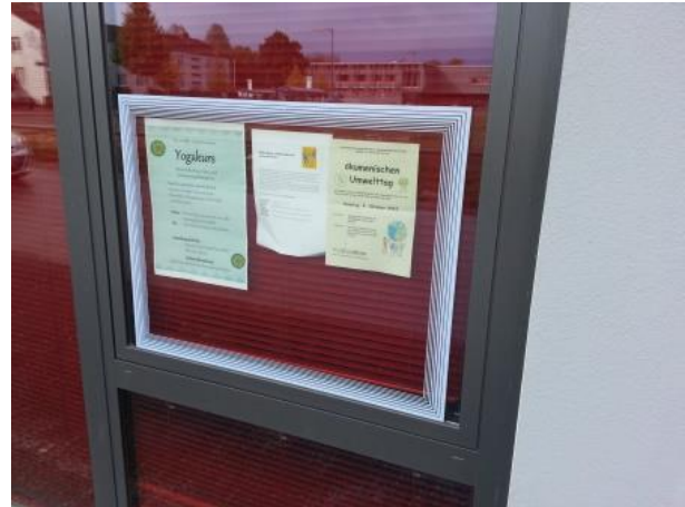
Oben, Aushang am SOS Familien- und Beratungszentrum Riem