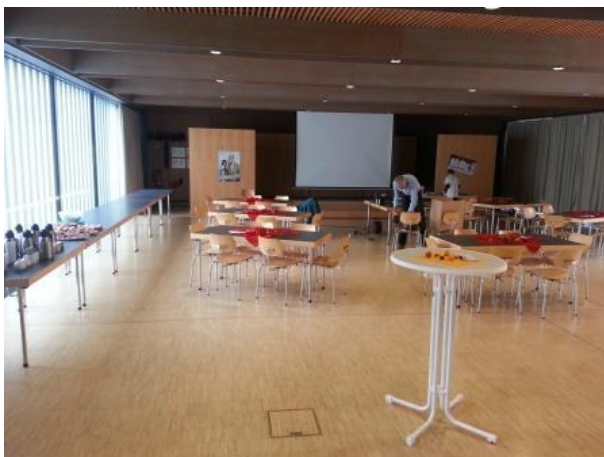
Letzte Vorbereitungen im Pfarrsaal