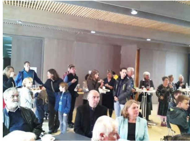
Blick ins Publikum