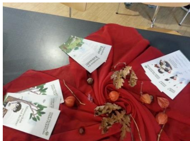
Tischdeko und Flyer