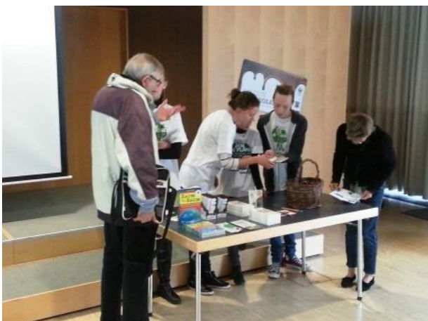
Interessierte Fragen nach dem Vortrag